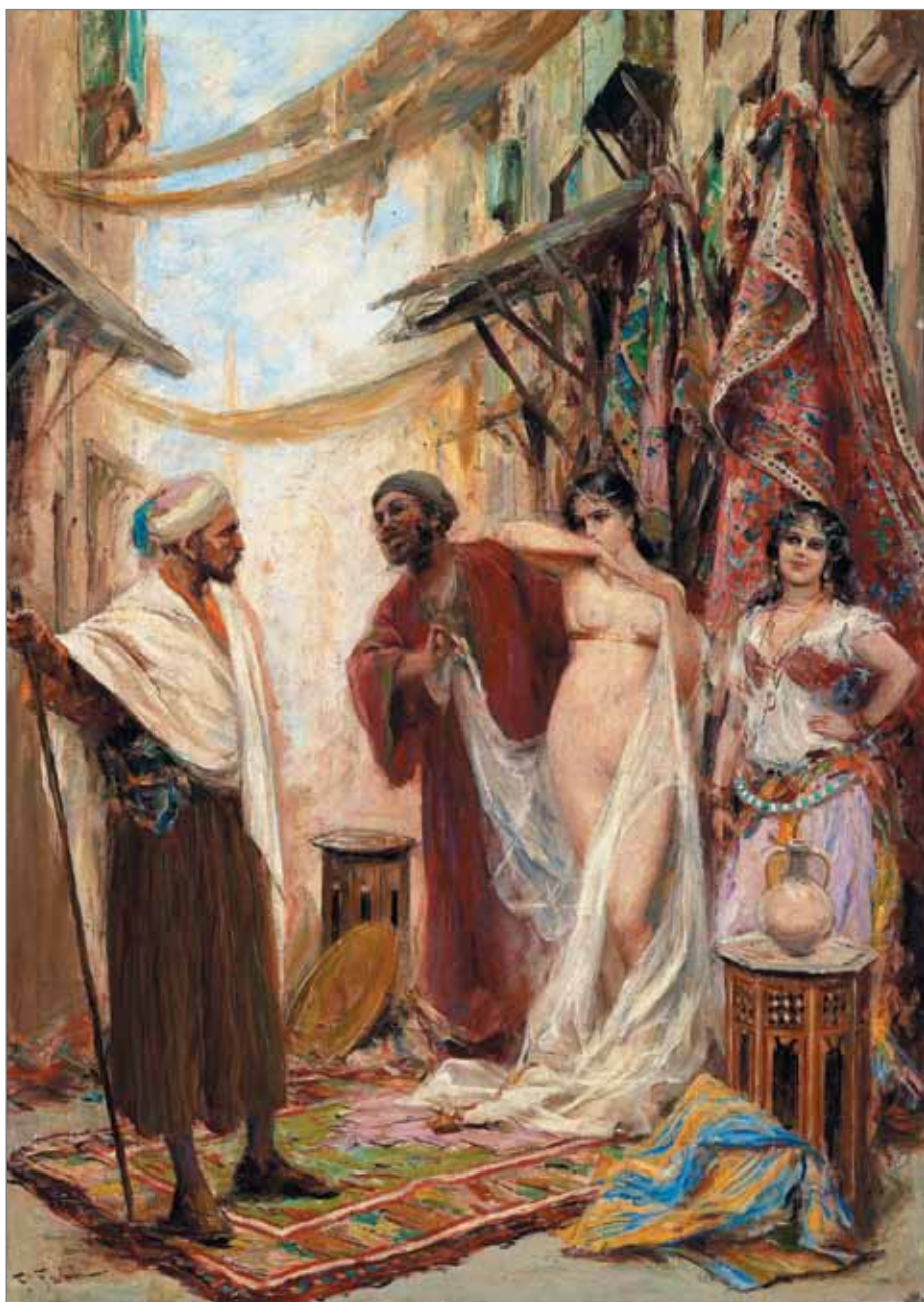
Фабио Фабби. Выбор невольницы.

Возить с собой крупные суммы денег на выкуп пленных посланникам было нельзя — крымские правители не раз просто грабили русские посольства, не стесняясь правилами дипломатического этикета 25 . Если с рабовладельцем удавалось договориться о цене, то