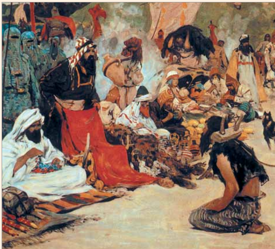
Продажа невольника. Фрагмент картины С. В. Иванова.

Количество пленных, уведённых крымцами из России в XVI веке, не поддаётся подсчёту из-за недостатка источников, однако в первой половине XVII века оно составило минимум 200 тысяч человек 6 . В этот период набеги были особенно частыми и разори-