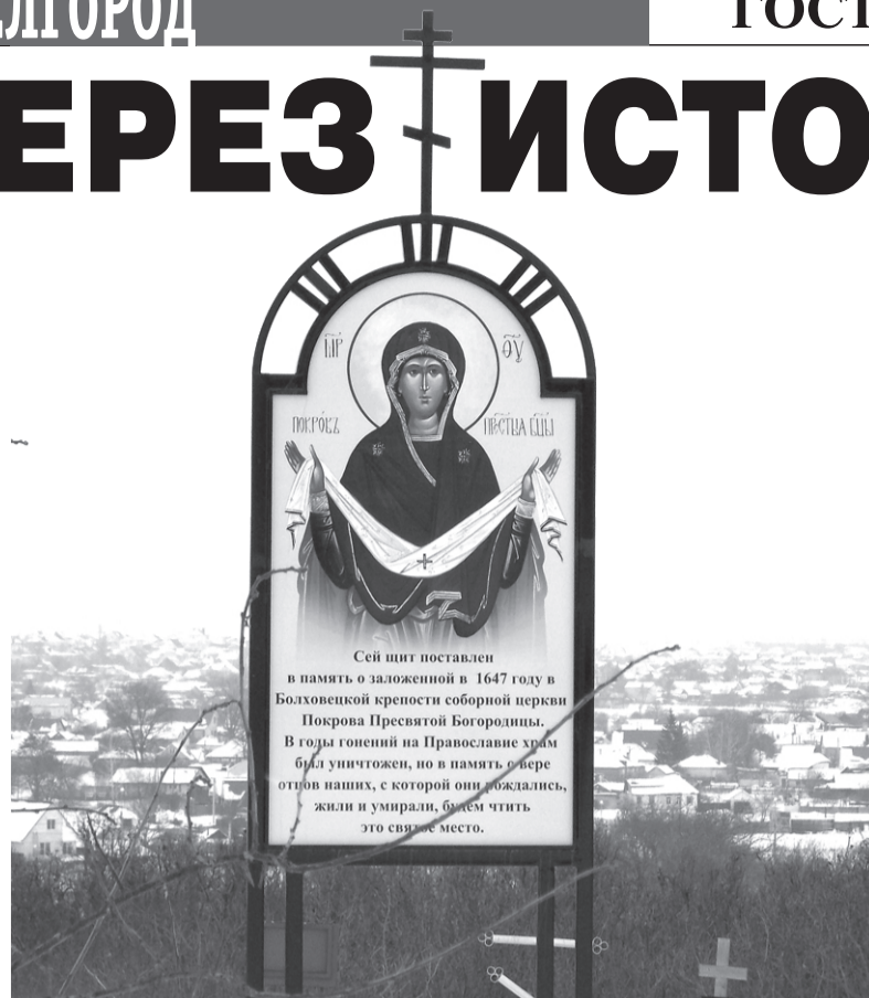
Памятный знак установлен историческим обществом «Ратник» на месте соборного храма крепости Болховец.

В Белгородском районе на горочке недалеко от впадения речки Искринки в речку Везёлку была крепость Болховец, основанная в 1646 году как город на Белгородской черте. С этого древнего места открывается вид на сегодняшний Белгород и широкую пойму Везёлки. В наше время мы видим на местах бывших городов погосты-кладбища, их появление связано в первую очередь с почитанием соборных храмов, находившихся в крепостях. Такую историю имеет и Болховец. На месте соборного храма в честь Покрова Пресвятой Богородицы мы всем миром установили памятный знак. На окружающий это место могилах указаны фамилии древних служилых родов, коренных жителей, фамилии которых тесно вплетены в историю - Белгорода, Болховца и Карпова. Например, Семейкины - это один из родов болховских священников, Половнёвы - это площадные дьячки, которые в том же 17-м веке были писарями в этой крепости, переписывали личный состав, драгуны Рогозины и пушкары Лавровы, стрельцы Черных, казаки Стрыгуновы и многие